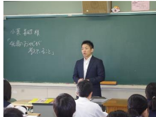
1 年 6 組