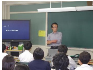
2 年 3 組