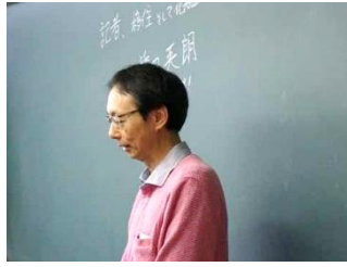
1 年 1 組