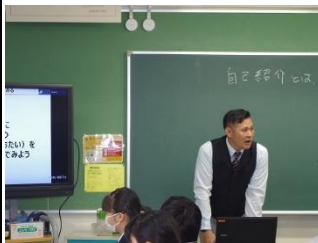
2 年 1 組