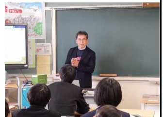
3 年 2 組