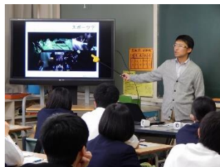
3 年 5 組