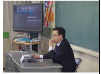
1 年 3 組