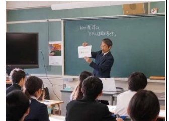
1 年 7 組