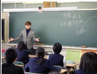
2 年 5 組