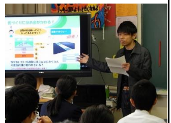
3 年 6 組