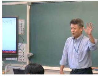
1 年 2 組