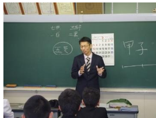
2 年 6 組