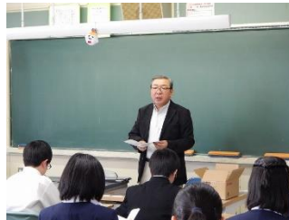
2 年 2 組