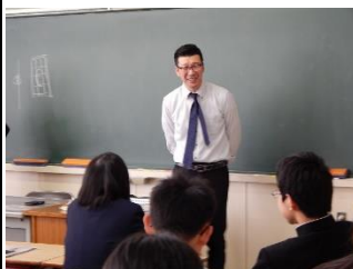
3 年 3 組