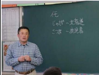
1 年 4 組