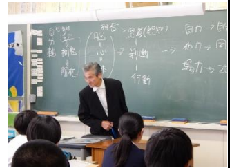
2 年 4 組