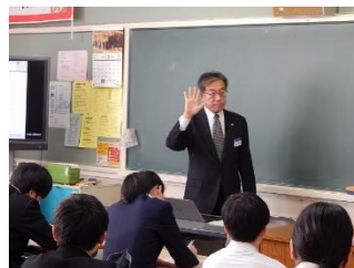
3 年 4 組