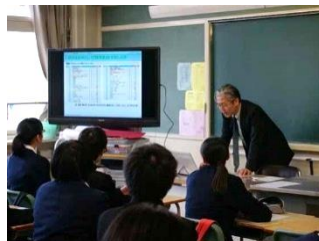
3 年 1 組