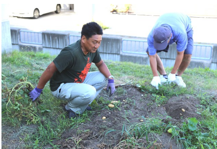
農場長、今年もありがとうございました