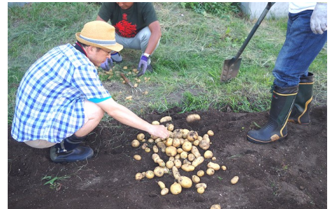
少し小芋が多かったかな