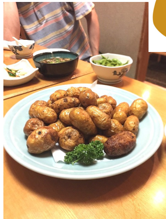
素揚げに大変身！ここはどこ？