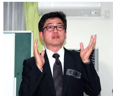
黒澤校長先生(4年目!)