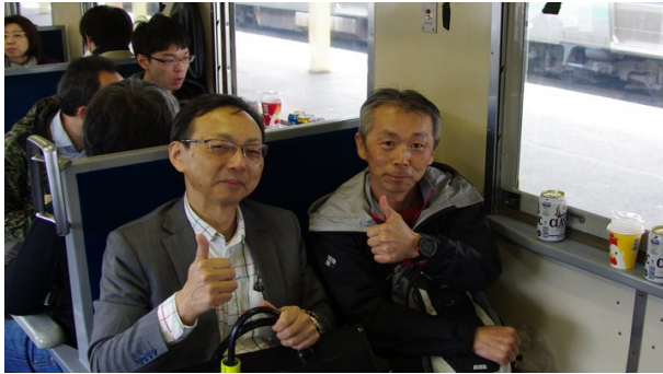
種田さんも無事合流