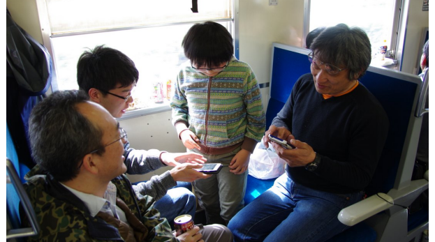
とある乗り鉄アプリの神様ふたり