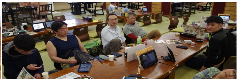
そしてふとみ銘泉でまったり…